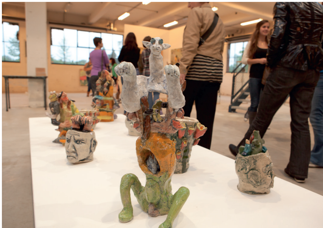
Grillige beelden van Taktiek Keramiek

De publicatieset van het onderzoek Kunst Inclusief, bestaande uit een boek, verhalenbundel, dvd en dialoogspel, is verkrijgbaar bij Special Arts.