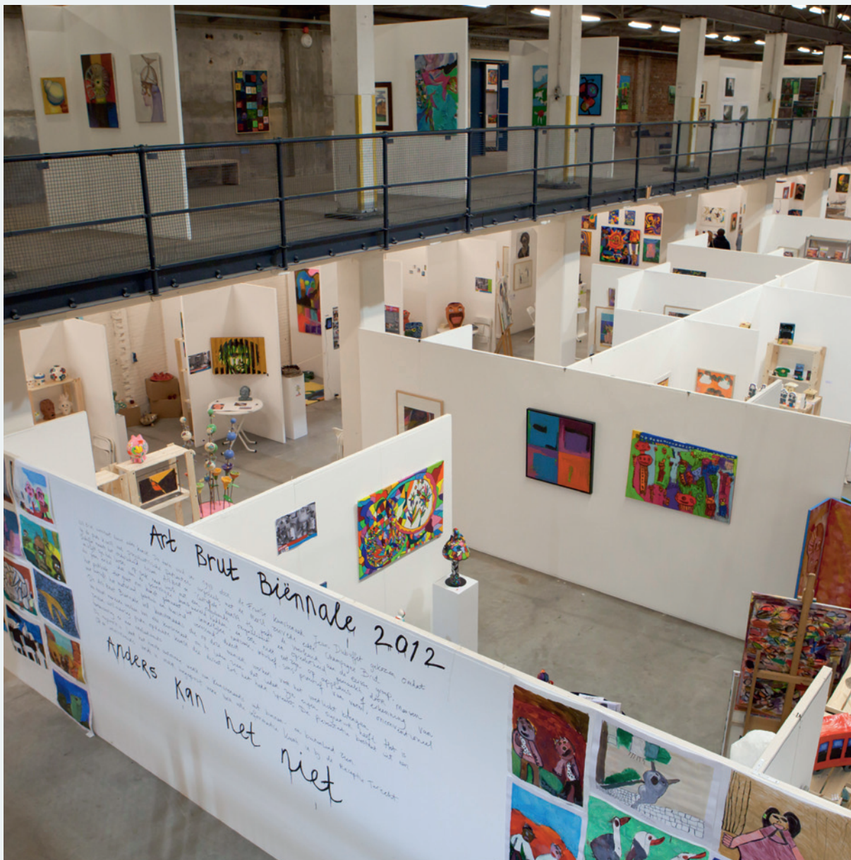
Presentatie van de ateliers op de Special In+Out